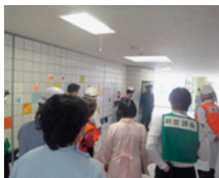
消火栓の使い方指導